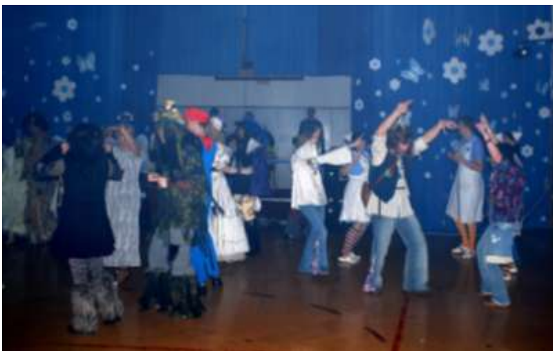
Maškarní pro dospělé