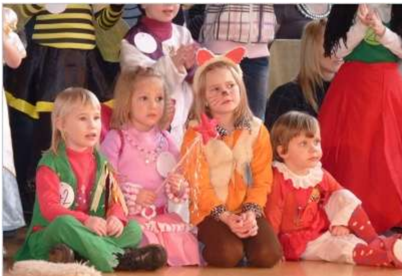
Dětský maškarní karneval