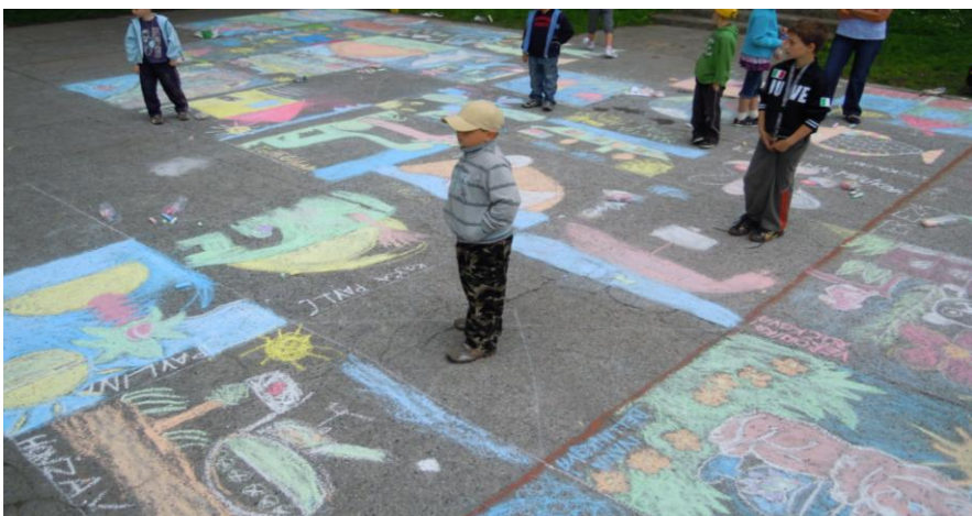
„Kreslení na chodníku“