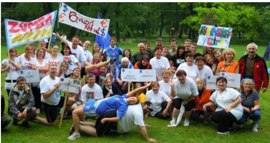
„Hry bez venkovských hranic napříč Kunínem“